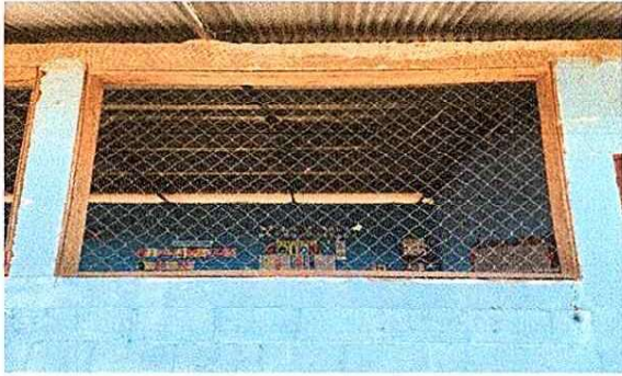
Foto 1: Sustrucción de mayo por balcon para mayor seguridad de los alumnos