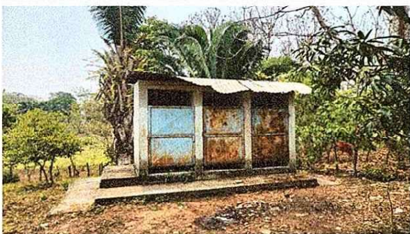
Foto 5: Mejramiento de estructura y cubierta, sustitucion de puertas de baño en mal estado