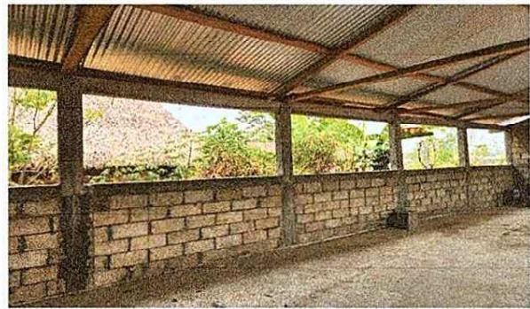
Foto 2: Instalacion de balcones en el aula nueva del establecimiento